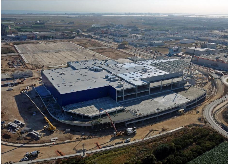
Figura 3.- Complejo IKEA en Alfafar (Valencia). Los centros logísticos se han convertido en edificaciones cuya construcción es fundamentalmente industrializada en hormigón, por lo que requieren una mayor implementación de elementos BIM