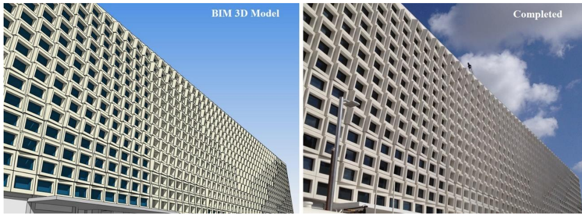
Figura 1.- BIM: del proyecto a la obra.