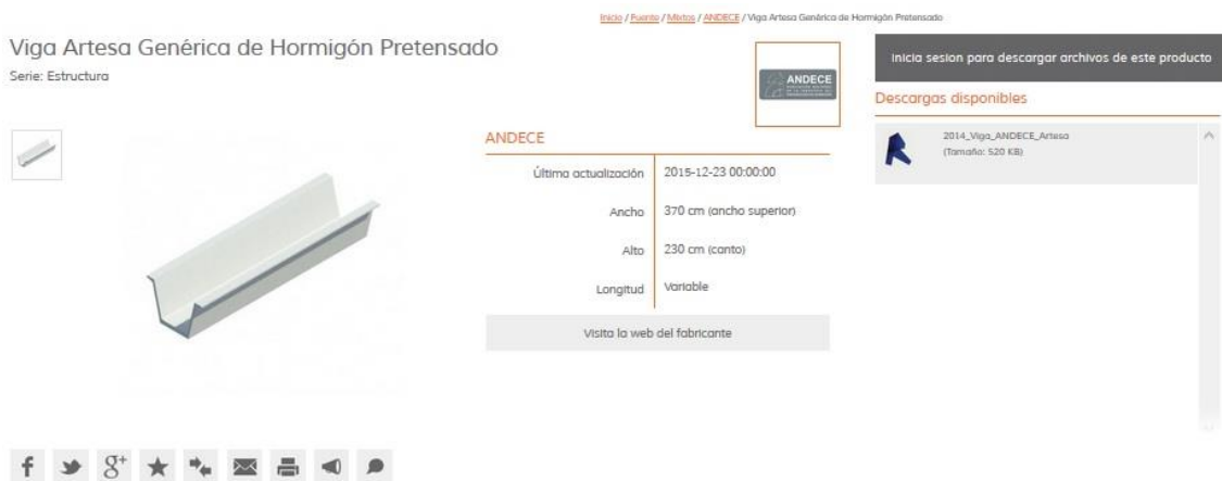
Figura 2.- Ventana de presentación de la viga artesa prefabricada de hormigón en la galería BIMETICA

Actualmente se dispone de dos galerías que se encuentran accesibles en las webs de BIMETICA [3] y BIMObject [4] dos de las plataformas más importantes de “objetos BIM” de construcción, para libre descarga.